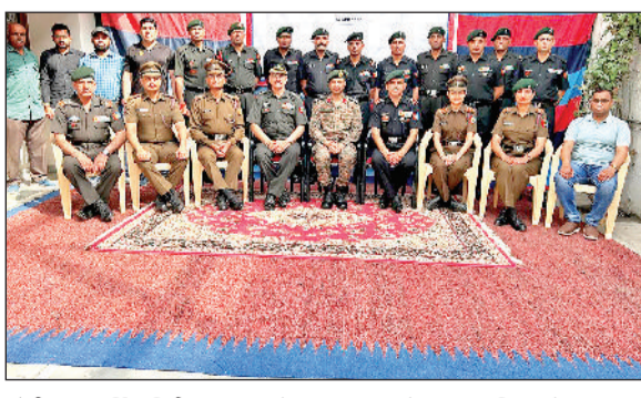
सोनीपत। वार्षिक निरीक्षण पर पहुंचे ग्रुप कमांडर के साथ बटालियन के अधिकारी।

सभी एनसीसी अधिकारियों से परिचय लेते हुए उनसे संबंधित स्कूल- कॉलेज में एनसीसी ट्रेनिंग के बारे में विस्तार से चर्चा की गई। बटालियन के पीआई स्टाफ से परिचय लेते हुए उनको ट्रेनिंग संबंधित विशेष हिदायतें जारी की। ग्रुप कमांडर द्वारा बटालियन के