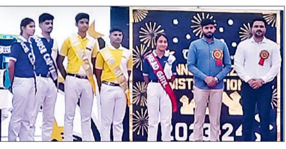
गोहाना। मेधावी विद्यार्थियों को सम्मानित करते अतिथि।