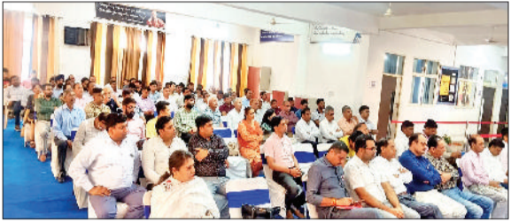
सोनीपत। बैठक में उपस्थित निजी स्कूल संचालक।

निजी स्कूल संचालकों का दावा मंत्री की ओर से मिला है 10 दिन का समय, विभाग का कहना नहीं मिले कोई ऑर्डर