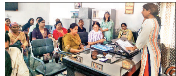
सोनीपत। चौपाल में उपस्थित ग्रामीण एवं विद्यालय स्टाफ।